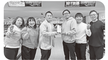
団体競技_優勝チーム