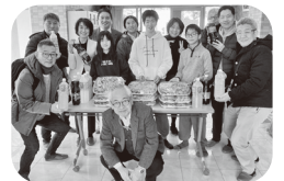
お正月は「お節」でくつろいでください