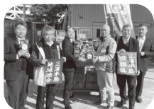
今年もクリスマスプレゼントをいただきました

①「A児童ホーム」へ12月14日にクリスマス会が行われ、サンタの衣装を着た職員のマジッ