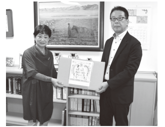
施設にタオルを寄贈 (2024 年)

2025 年メーデーにおいても、みなさまの取り組みが、大きな力となって社会に還元されます。ご理解・ご協力をお願いいたします。