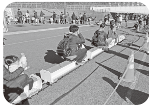
in市民祭り_乗車の風景

2024年に市制100周年を迎えた川崎市では様々なイベントが開催される中、市民祭りは富士見公園一帯を会場として12月7日と8日の2日間に渡って盛大に開催