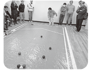
団体競技_ポッチャの風景

しました。具体的には、加盟組織から地区・ブロックの代表30人（1地区・ブロック各5人）が参加し、ポッチャによる総当たり戦で競いました。競技の結果、中原地区・ブロックが2年連続の優勝を勝ち取りました。競技後は地区・ブロックの応援を含めた50人でボウリング&交流会を通じて地区・ブロック相互で交流し、連帯を深めました。