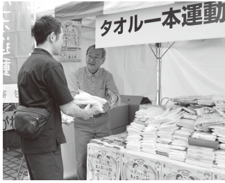
たくさんのタオルが山積み (2024 年)

ご家庭や職場で使われていないタオル (未使用) を集め、介護施設や児童養護施設などに寄贈し、社会貢献をする取り組みを実施しています。2024 年は 9 か所のメーデー会場において、組合員、ご家族、労働組合、企業などの皆様から 7,996 本 (2024 年 7 月時点) のタオルを集めることができました。