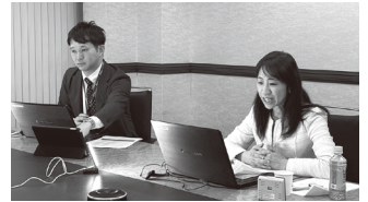
セミナーの様子 1月29日

て講演がありました。当日74名が参加し、視聴された方々の多くから好評をいただきました。