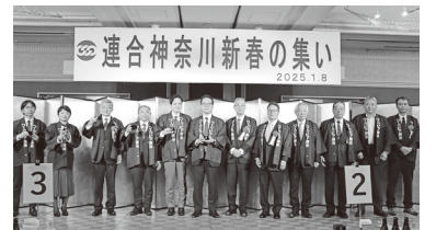
乾杯! 壇上に勢ぞろい

続いて、政党代表、現職国会議員、自治体首長、議員団会議会員等よりご挨拶をいただきました。