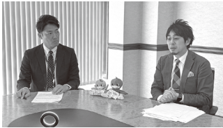
トークセッションの様子 1月26日

1月26日(日) NISA・iDeCo オンラインセミナー「税制優遇を活かして賢く資産形成」 1月29日(水) 若年組合員向け オンラインセミナー「60分でわかる! 20代から始めるお金のほなし」