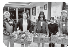
サンタさんになって施設へお届け