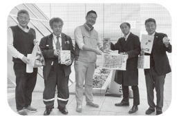
児童施設へクリスマスに合わせてプレゼントをお届け

②12月18日は「Bホーム」へ、クリスマスのお菓子や京急ストアから玩具、三浦半島